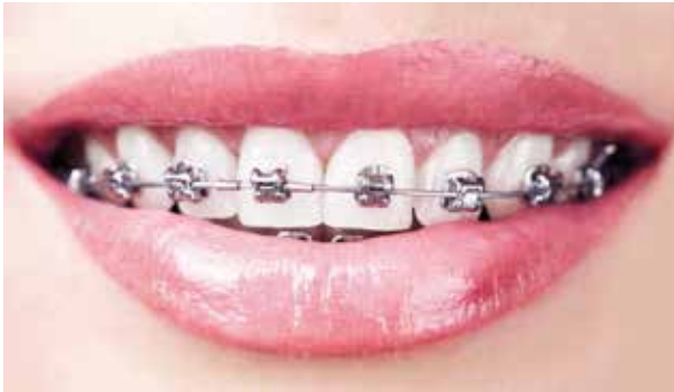
Imagem com aparelho autoligado