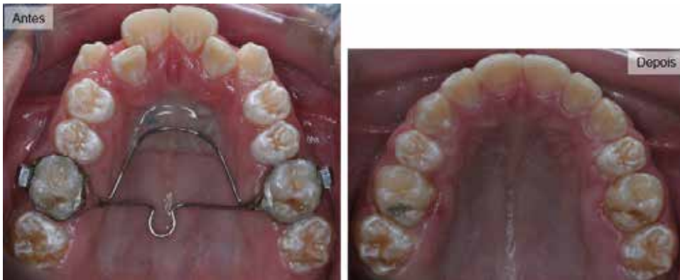
Imagem oclusal com apinhamento

Na técnica do aparelho autoligado a falta de espaço em alguns casos, reduz a necessidade de extrações dentais, pois o aparelho deixa o sorriso mais “amplo”, o que cria espaço para atingir o resultado desejado.