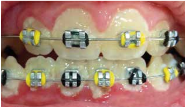
Imagem com aparelho convencional