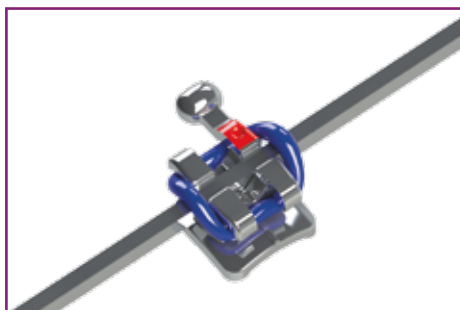
Braquete com borrachinha do aparelho convencional: atrito entre o metal e a borracha o que dificulta a movimentação.

Esta força maior causa mais sensibilidade nos dentes após a manutenção do aparelho e dependendo da quantidade, ela pode até gerar uma reabsorção grave nas raízes dos dentes.